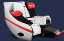
**อพเทค ณ วันที่ 26/02/67**