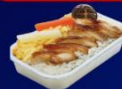
ข้าวหน้าไก่ย่างเทรียคิ

บริการอาหารร้อน และ น้ำดื่ม บนเครื่อง ขาไป และ ขากลับ