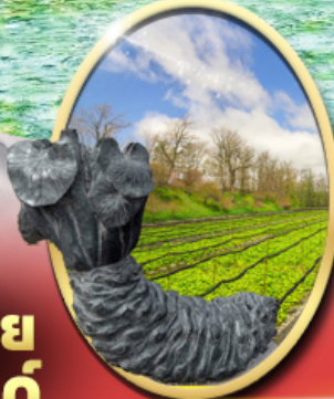
ฟาร์ม วาซาบิ ไดโอะ