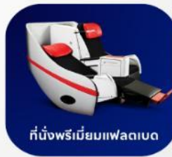
ที่นั่งพรีเมียมแฟลตเบด