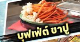
บุฟเฟต์ ซาซุ