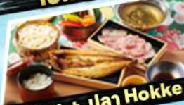
เอ๊กซาซุ + ปลา Hokke

36,919 ราคา เริ่มต้น บาท รวมภาษีมูลค่าเพิ่ม 7%