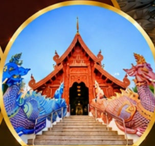
วัดเด่นสะหลีศรีเมืองแกน