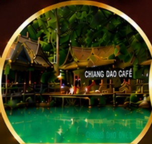
ท่าเชียงดาว