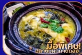
มีอพิเศษ! ปลาต้มผักกาดดอง