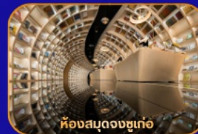
ห้องสมุดจงซูเกอ