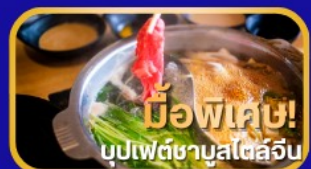
มีอาหารพิเศษ! บุฟเฟ่ต์ชาบูสไตล์จีน

เดินทาง : สิงหาคม - ตุลาคม 2569 6 วัน 4 คืน น้ำหนักกระเป๋า 23kg