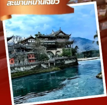
พิพิธภัณฑ์หออูรักซ์แพนด้า