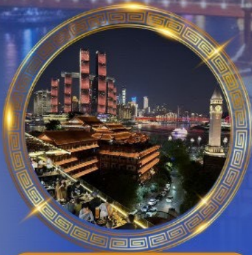
มื้อค่ำร้านอาหารวิวหลักล้าน