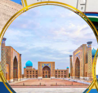
จัตุรัสเรจิสถาน