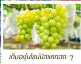
เก็บองุ่นไข่มุกสแมคสด ๆ

🇯🇵 เที่ยวไทย - ไชยาท์ (รวมบัตรเข้าสวนสนุก USJ)