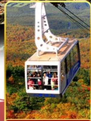
นั่งกระเช้าอิกโกะ