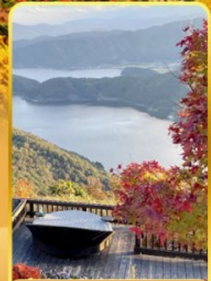
ชมยูบาคาเกะ