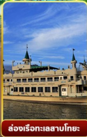
ล่องเรือทะเลสาบโทเยะ