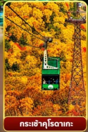
กระเช้าคุโรดากะ