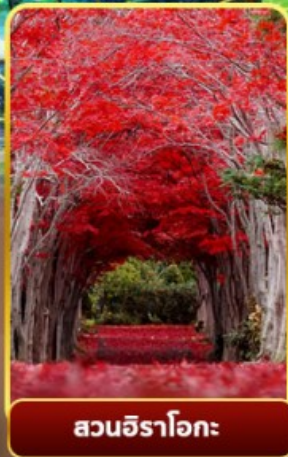
สวนอิราโอกะ