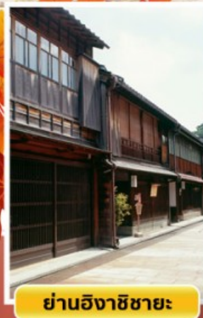
ย่านอิงาชิบายะ