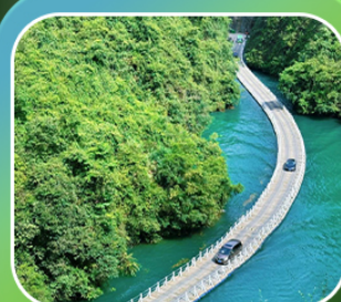
“หุบเขาสิงโต ชื่อจื่อกวน”