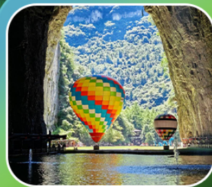
“ถ้าถึงหลง”

เที่ยวจีน 2 มณฑล เสฉวน+หูเป่ย์ (เมืองฉงชิ่ง+เมืองเอนฉือ) • ถ้าถึงหลง ล่องเรือมังกรกังสุ่ยชมวิวยามค่ำคืน • ผิงซานแกรนด์แคนยอน (รวมล่องเรือ) หงหยาดัง • วัลลว้ออื่น • ถนนคนเดินเจียฟางเป่ย์ • ตึกตะเกียบ