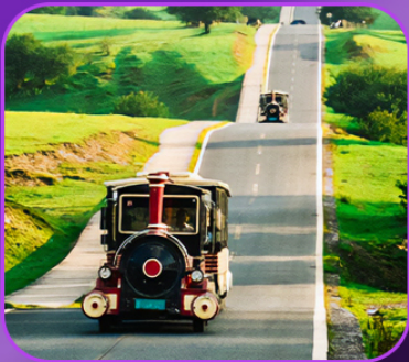
“อุทยานเขานางฟ้า”

บินตรงลงชิง • อุ๋หลง • ระเบิดงแกว • อุทยานแห่งชาติหลุมฟ้า • ลิฟต์แกว อุทยานเขานางฟ้า • ไค่วซิงโหลชั้น 1 กลายเป็นชั้นที่ 22 • อาคารตะเกียบ ถนนคนเดินเจียฟางเป็ย • หงหยาดัง • นิ่งรอกไฟทะลุติ๊ก • วัดหลิวฮั่น