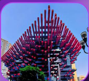
"อาคารตะเกียบ"

บินตรงฉงชิ่ง • อุ่หลง • ระเบิดงแกว • อุทยานแห่งชาติหลุมฟ้า • ลิฟต์แกว อุทยานเขานางฟ้า • ไค่วซิงโหลซัน 1 กลายเป็นชั้นที่ 22 • อาคารตะเกียบ ถนนคนเดินเจียฟางเป็ย • หงหยาดัง • นั้งรถไฟทะลุดึก • วัดหลัวฮัน