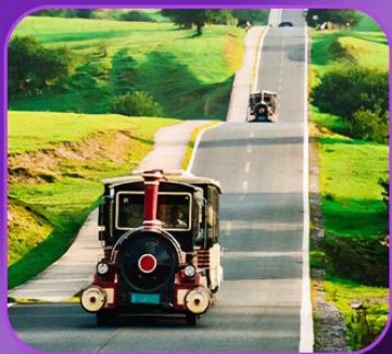
"อุทยานเขานางฟ้า"

บินตรงฉงชิ่ง • อุ่หลง • ระเบิดงแกว • อุทยานแห่งชาติหลุมฟ้า • ลิฟต์แกว อุทยานเขานางฟ้า • ไค่วซิงโหลซัน 1 กลายเป็นชั้นที่ 22 • อาคารตะเกียบ ถนนคนเดินเจียฟางเป็ย • หงหยาดัง • นั้งรถไฟทะลุดึก • วัดหลัวฮัน