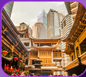
“วัดหลิวฮั่น”