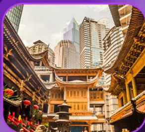
"วัดหลัวฮัน"