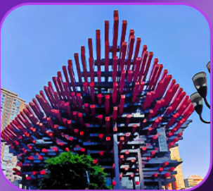
“อาคารตะเกียบ”