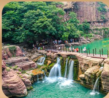
“อุทยานหยุนไต้ซาน”

ชมถ้ำหลงเหมิน มรดกโลกที่เมืองลั่วหยาง • สุสานจิ้นซีฮ่องเต้ • ศาลเจ้ากวนอู วัดเส้าหลิน + ป่าเจดีย์ + ชมโชว์กังฟู • เมืองโบราณลั่วอี้ • อุทยานหยุนไต้ซาน เจดีย์ห่านป่าใหญ่ • ถนนวัฒนธรรมต้าถัง • ถนนคนเดินอิสลาม • จัตุรัสหอระบิง