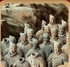
“สุสานจิ้นซีฮ่องเต้”