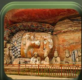
“ ผาหินแกะสลักต้าจู้ ”