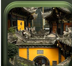
“ วัดหลิวอัน ”