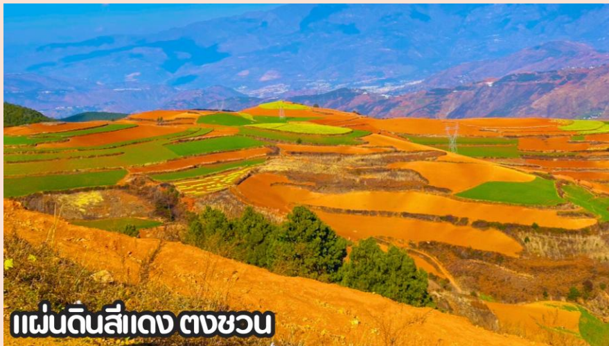
แผ่นดินสีแดง ตงชว่น

นำทุกท่านเดินทางสู่ เมืองตงชว่น (DONGCHUAN) หรือที่รู้จักกันในชื่อ หงถู่ตี้ ซึ่งแปลว่าแผ่นดินสีแดง เมืองตงชว่นตั้งอยู่ทางทิศตะวันออกเฉียงเหนือของมณฑลยูนหนาน มีภูมิประเทศเป็นทิวเขาสลับซับซ้อน ชาวพื้นเมืองส่วนใหญ่ประกอบอาชีพปลูกข้าวสาลี มันสำปะหลัง ผักต่างๆและดอกไม้ชานาพันธุ์ และตงชว่น ยังถือว่าเป็นจุดท่องเที่ยวไฮไลต์อีกหนึ่งแห่งของคุณหมิง เป็นจุดที่นักท่องเที่ยวนิยมแวะมาเก็บภาพบรรยากาศที่สวยงาม นำท่านชม ภูเขาเจ็ดสีแห่งตงชว่น หรือ แผ่นดินสีแดง (DONGCHUAN RED LAND) ตั้งอยู่ในเขตเมืองตงชว่น ทางตอนเหนือของคุณหมิง มีภูมิประเทศเป็นทิวเขาสลับซับซ้อนและ