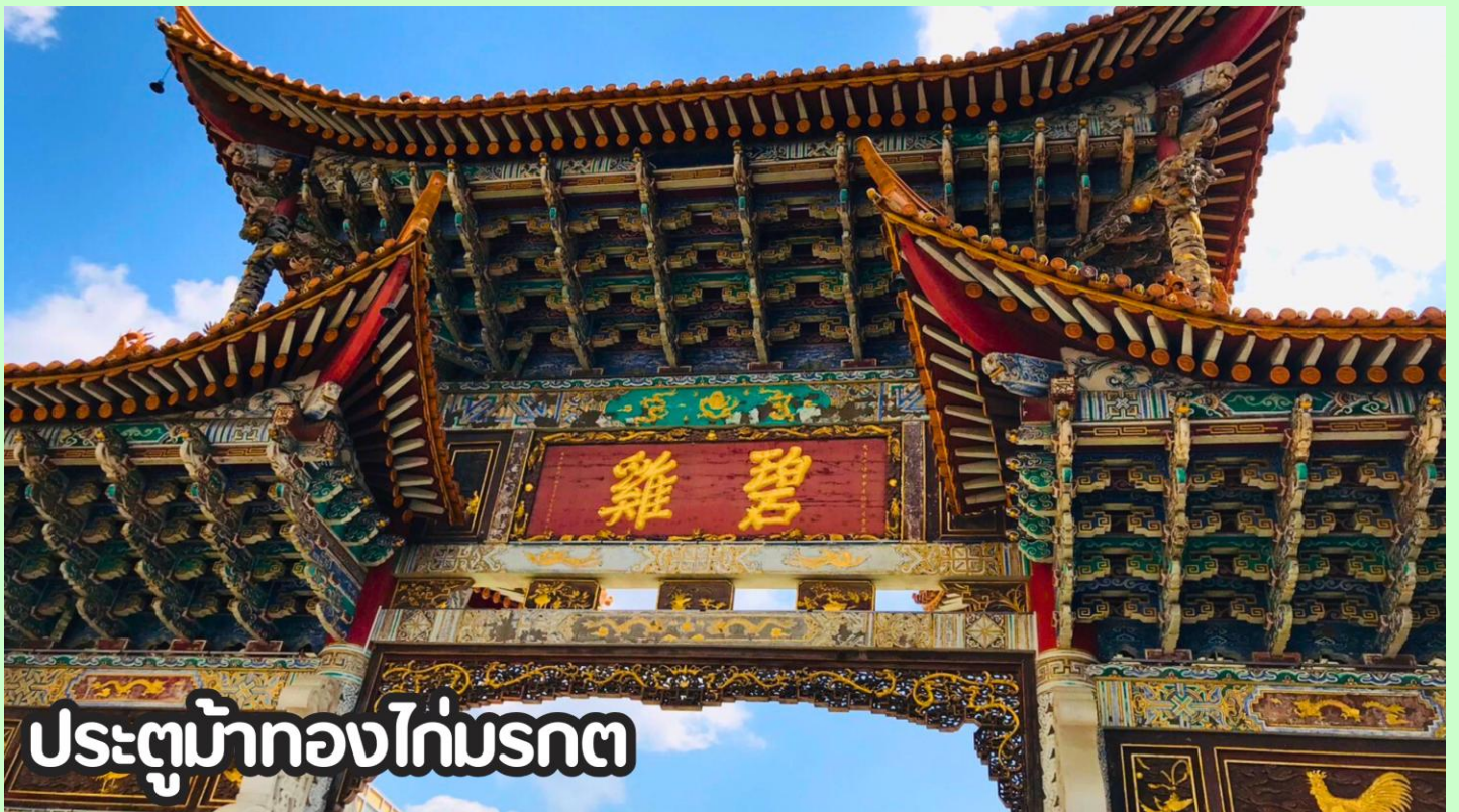
ประตูม้าทองไก่มรกต

แวะช้อปปีง POP MART อีสระให้ท่านได้เลือกช้อปตามอัธยาศัย น้อง Cry Baby The dressing Room น้อง Hiroshi เด็กชายที่ ทำหน้าเศร้าตลอดเวลา น้องมอลตี้ น้องลาปู๊ Pop Bean ตุ๊กตาคารทอยและของสะสมอีกมากมาย จนถึงเวลานัดหมาย