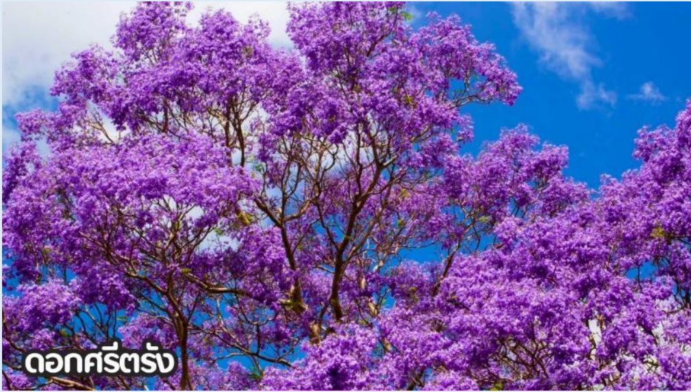
ดอกศรีตรัง

(ปลายเดือนพฤษภาคม-มิถุนายน): ชมดอกไม้ไฮเดรนเยีย ดอกไฮเดรนเยียที่คุนหมิง ประเทศจีน บานสะพรั่งสวยงามที่สุดในช่วงเดือนมิถุนายน โดยเฉพาะบริเวณทุ่งไฮเดรนเยีย (The Middle Sea Hydrangea Kunming) ซึ่งมีหลากหลายสีทั้งฟ้า ชมพู และม่วง เป็นจุดถ่ายภาพยอดนิยมที่ห้ามพลาด เนื่องจากอากาศที่เย็นสบายและทิวทัศน์ที่งดงาม