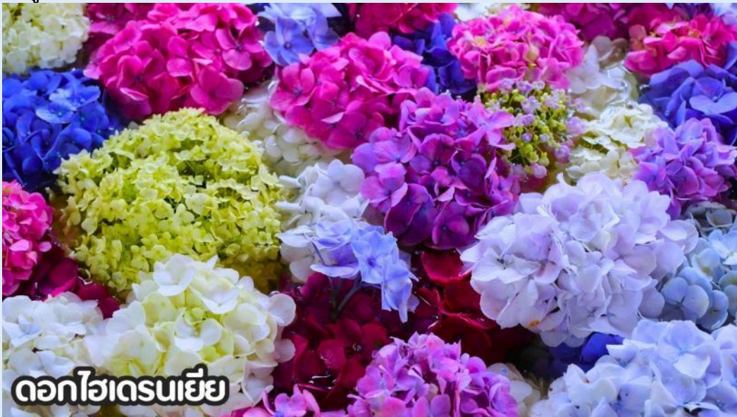
ดอกไฮเดรนเยีย

(ปลายเดือนพฤษภาคม-มิถุนายน): ชมดอกไม้ไฮเดรนเยีย ดอกไฮเดรนเยียที่คุนหมิง ประเทศจีน บานสะพรั่งสวยงามที่สุดในช่วงเดือนมิถุนายน โดยเฉพาะบริเวณทุ่งไฮเดรนเยีย (The Middle Sea Hydrangea Kunming) ซึ่งมีหลากหลายสีทั้งฟ้า ชมพู และม่วง เป็นจุดถ่ายภาพยอดนิยมที่ห้ามพลาด เนื่องจากอากาศที่เย็นสบายและทิวทัศน์ที่งดงาม