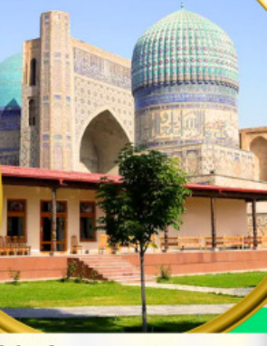
Bibi Khanym Mosque