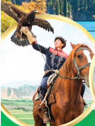
ชมโซว์นกินทรีย์