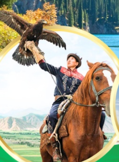
ชมโซว์นคอินทรีย์