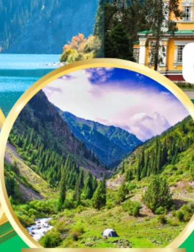
Ala Archa National Park