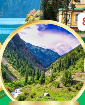
Ala Archa National Park