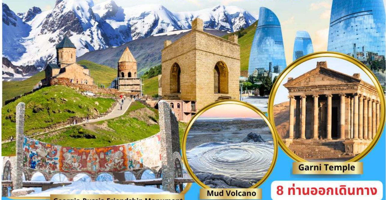
Georgia-Russia Friendship Monument