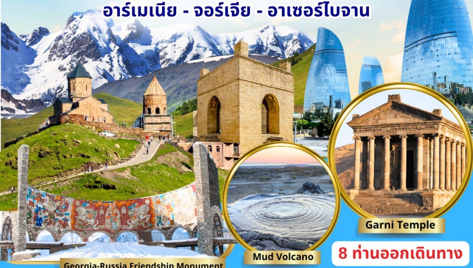
Georgia-Russia Friendship Monument