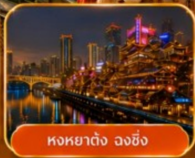
หงหยาดัง ฉงชิ่ง