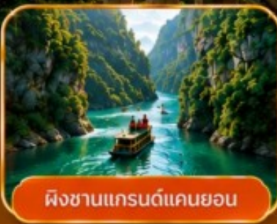
ผิงชานแกรนด์แคนยอน