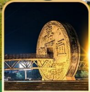
จัตุรัสเหรียญโบราณ