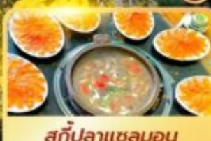
สุกัปลาเซลมอน