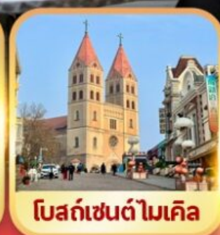
โบสถ์เซ็นต์ไมเคิล