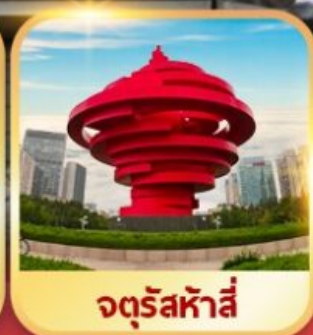
จตุรัสหาลี่