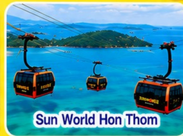
Sun World Hon Thom