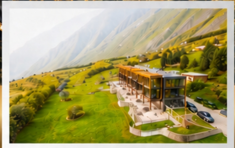
THE ROOM KAZBEGI HOTEL