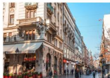
วิหารเซนต์ซาวา บ่อมปราการเบลเกรด ถนน Knez Mihailova

** พักที่ Abba Hotel 4* หรือเทียบเท่า **