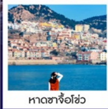
หาดซาโจว