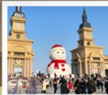
ตึกตาคิมะยักซ์