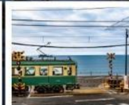
รถไฟเอโนะเด็ง