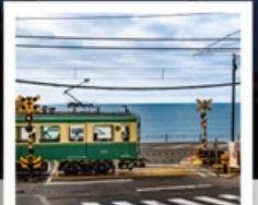
รถไฟเอโนะเด็น