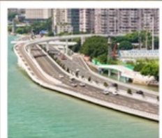
สะพานเหยียนหู่เจียว

1 ประเทศ 2 ระบบ ในทริปเดียว!! ข้ามทะเลจากจีน...สู่จินเหมิน (ไต้หวัน)