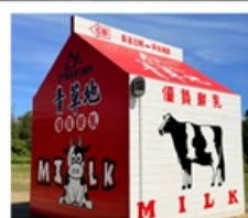
ฟาร์มโคนมจินเหมิน