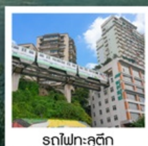
รถไฟฟ้าทุติย

มหาศาลาประชาชน / รถไฟฟ้าทุติย ถนนคนเดินเจียงฟางเป่ย์ / ลงเรือสำราญ CENTURY VICTORY CRUISE ล่องเรือแม่น้ำแยงซีเกียง / โชว์สามก๊ก / ช่องแคบอุสึย ช่องแคบซวีตงเสีย / นั่งเรือเล็กชมเส้นหนึ่งซี / งานเลี้ยงอำลาจากทางเรือ นั่งลิฟท์ข้ามเขื่อนซานเสียต้าป้า / Three Gorges Project Museum