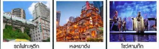
รถไฟฟ้าลัด