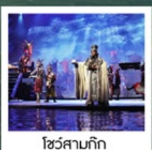
โชว์สามก๊ก