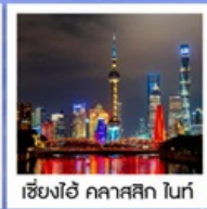
เซี่ยงไฮ้ คลาสสิก ไทท์