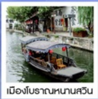
เมืองโบราณหนานสวิน