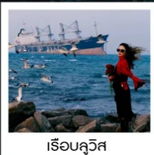
เรือควิวส

หอคอยกาลเวลา / รูปปั้นปลาวาฬ / ถนนโบราณเตาหยาง / ย่านสงโงว 1920 / เมืองเว่ยไห่ / ถนนฮิวจวิปา / จตุรัสประตูแห่งความสุข ย่านอันลอฟาง / เรือควิวส / หาดซาจื่อฮิว / ถนนหลงเจียง / สะพานจันเจียว / หาดไซเบอร์ No. 3 ถนนจงซาน / โบสถ์ St.Emill / จตุรัส 54 / ศูนย์เรือใบโอลิมปิก / พิพิธภัณฑ์มิสเตอร์ชิงเต่า / ถนนโตตง / ท่าเรือประมงเหยียนโก