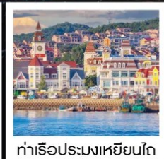
ท่าเรือประมงเหยียนโก