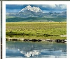
ดวงตาแห่งต่ำถาง