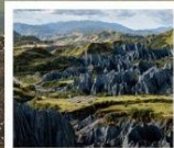
สวนหินปาเหมย์