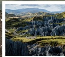
สวนหินป่าเหม่ย