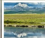
ดวงตาแห่งถ้ำกวาง