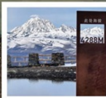
ปาหลางดิงตู