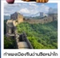
กำแพงเมืองจีนผ่านซือหม่าโต

เมืองโบราณกู่เป่ย์สุ่ยเจิ้น / กำแพงเมืองจีนด่านซือหม่าโต (รวมค่ากระเช้าขึ้น-ลง) / ชมวิวกำแพงเมืองจีนและเมืองโบราณ ยูนิเวอร์แซลปักกิ่ง (รวมค่าบัตรเข้า) / จัตุรัสเทียนอันเหมิน / พระราชวังโบราณฤดูร้อน / หอบูชาเทียนถาน คาเฟ่กาแฟบ้านน้ำตาด (TANG FANG CAFE) / พระราชวังฤดูร้อนอวิ๋เหอหยวน / ย่านชานหลี่ถุน (POP MART) / ถนนคนเดินไท่กู่หลี่