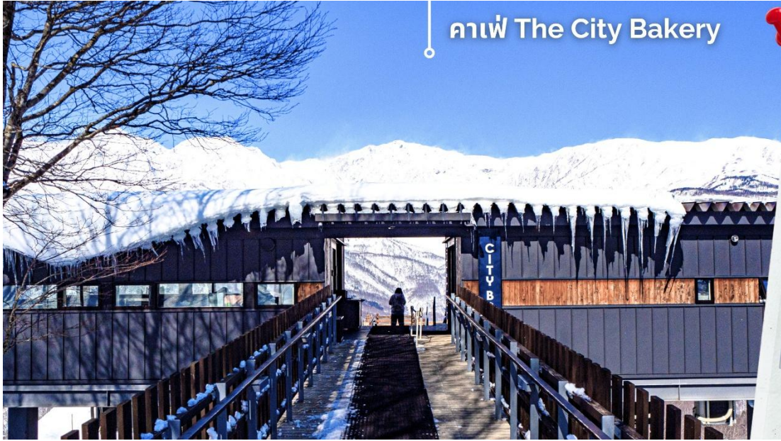
กาแฟ The City Bakery