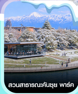
สวนสาธารณะคันซุย พาร์ค