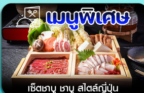
เช็ตซาบู ซาบู สีสต์ญี่ปุ่น