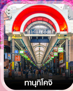
ทามุกิโคจิ

คอนเฟิร์ม ออกเดินทาง ทุกพีเรียด 2 ท่านขึ้นไป