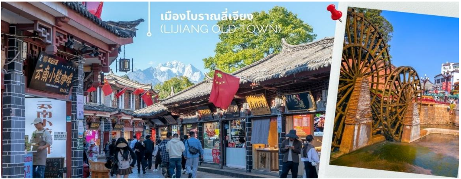
เมืองโบราณลี่เจียง (LIJIANG OLD TOWN)