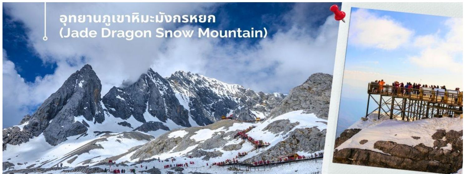
อุทยานภูเขาหิมะมังกรหยก (Jade Dragon Snow Mountain)

นำท่านชม อุทยานภูเขาหิมะมังกรหยก (Jade Dragon Snow Mountain) (รวมค่ากระเช้ากระใหญ่ ขึ้น-ลง) สู่จุดชมวิว ภูเขาหิมะมังกรหยก สูงจากระดับน้ำทะเล 4,506 เมตร ตั้งอยู่ในเขตปกครองตนเอง Yulong Naxi เมืองลี่เจียง มณฑลยูนนาน เป็นหนึ่งในสถานที่ท่องเที่ยวระดับ 5A เป็นอุทยานธรณีธารน้ำแข็งแห่งชาติ ครอบคลุมพื้นที่ 415 ตารางกิโลเมตร และภูเขามีสลักษณะเป็นลูกคลื่นและมีลักษณะคล้ายมังกรเงินที่บินได้ตั้งนั้นจึงได้ชื่อว่าภูเขาหิมะมังกรหยก ยอดเขาหลัก ซานจีไต่ว์ อยู่สูงจากเหนือระดับน้ำทะเล 5,596 เมตร ล้อมรอบด้วยเมฆและหมอกตลอดทั้งปี เป็นยอดเขาบริสุทธิ์ที่ไม่มีใครพิชิตได้ ภูเขาหิมะมังกรหยกเป็นหนึ่งในจุดชมวิวที่มีชื่อเสียงในลี่เจียงและเป็นภูเขาศักดิ์สิทธิ์ในใจของชาวนาซี มียอดเขาทั้งหมด 13 ยอด อุดมไปด้วยทรัพยากรการท่องเที่ยวทางธรรมชาติ และสามารถแบ่งออกเป็นพื้นที่หิมะ ธารน้ำแข็ง ทุ่งหญ้าอัลไพน์ ภูมิทัศน์ป่าดึกดำบรรพ์ ฯลฯ ภูเขาที่ปกคลุมด้วยหิมะเต็มไปด้วยความงดงาม ทรงพลัง และยังคงน่าเกรงขาม เมื่อฤดูกาลเปลี่ยนไป ดอกอาซาเลียที่เบ่งบานในระดับความสูงต่างๆ ทำให้เกิดทิวทัศน์ที่สวยงามที่สุดของภูเขาที่ปกคลุมด้วยหิมะ พื้นที่ที่สวยงาม ได้แก่ หมู่บ้าน Yushui, สวนกลาเซียร์, Blue Moon Valley และสถานที่ท่องเที่ยวอื่นๆ