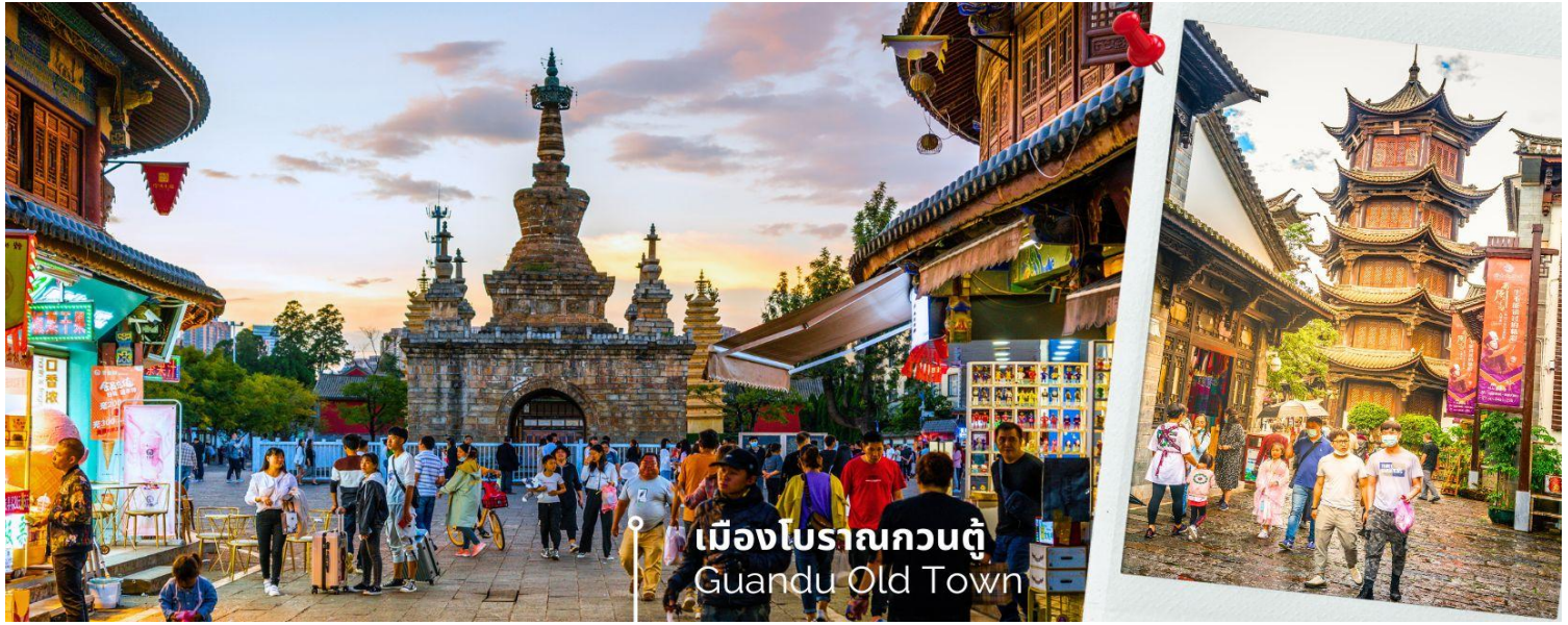
เมืองโบราณกวนตู Guandu Old Town

นำท่านชมบรรยากาศ เมืองโบราณกวนตู (Guandu Old Town) เป็นหนึ่งในต้นกำเนิดของวัฒนธรรมยูนนาน และยังถือเป็นหนึ่งในภูมิทัศน์ทางประวัติศาสตร์และวัฒนธรรม ที่สำคัญของเมืองคุนหมิง เมืองโบราณแห่งนี้ยังคงเป็นศูนย์กลางทางการค้าและคมนาคมที่สำคัญ ในอดีตเคยเป็นหมู่บ้านชาวประมงในสมัยราชวงศ์ถัง เมืองกวนตูยังเป็นเมืองแรกๆ ที่ศาสนาพุทธทางไนทิเบตได้เริ่มเผยแผ่เข้ามาในดินแดนยูนนาน