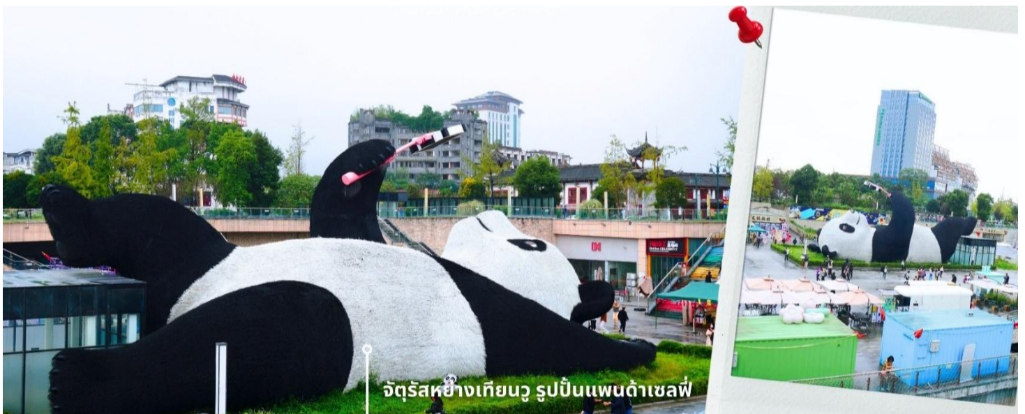
จัตุรัสหยางเทียนหวู่ รูปปั้นแพนด้าเซลฟี

นำท่านเดินทางไปยัง จัตุรัสหยางเทียนหวู่ เป็นจุดเช็คอินที่สำคัญสำหรับคนที่มาเที่ยวที่ เมืองตูเจียงเยียน บริเวณจุดต่ำข่า อำเภอดูเจียงเยียน นครเฉิงตู ไฮไลท์ของจัตุรัสหยางเทียนหวู่ คือ ประติมากรรม แพนด้ายักษ์ที่กำลังนอนหงายท้องยื่นมือถือไม้เซลฟีสีชมพู ซึ่งออกแบบโดยนักออกแบบชื่อดัง Florentijn Hofman รูปปั้นแพนด้า ยักษ์มีความยาว 26 เมตร กว้าง 11 เมตร สูง 12 เมตร และหนัก 130 ตัน แบบท่าทางสบายๆของแพนด้าที่ความประทับใจและรอยยิ้มให้กับผู้ที่มาเยือนจัตุรัสหยางเทียนหวู่ สามารถดึงดูดนักท่องเที่ยวได้เป็นจำนวนมากเลยทีเดียว เป็นการแสดงออกด้วยภาษาทางศิลปะแบบหนึ่งที่สะท้อนชีวิตในท้องถิ่น มอบความรู้สึกสนิทสนมและมีความสุขกับผู้ชม อิสระเดินชมถ่ายภาพ รูปปั้นแพนด้าเซลฟี ตามอัธยาศัย ที่นี่เป็นจุดเช็คอินที่เหมาะสมสำหรับทุกเพศทุกวัย หากคุณกำลังมองหาสถานที่ท่องเที่ยวใหม่ๆ ที่เต็มไปด้วย ความทรงจำดีๆ จัตุรัสหยางเทียนหวู่ คือคำตอบที่สมบูรณ์แบบ