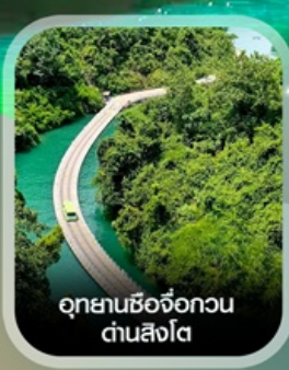
อุทยานซีจื่อกวน ตำบลสิงโต