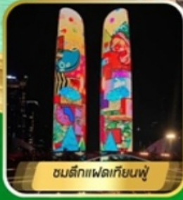
ชมตึกแฟลตเทียนฟู