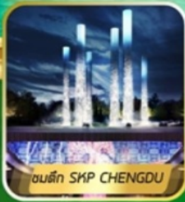
ชมตึก SKP CHENGDU