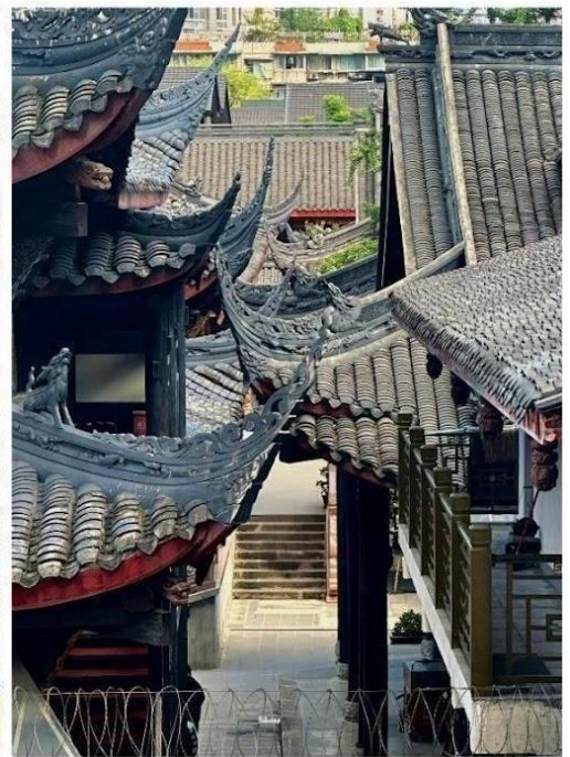
วัดต้าจื่อ