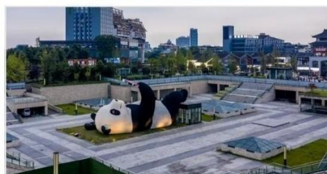
รูปปั้นแพนด้าเซลฟ์